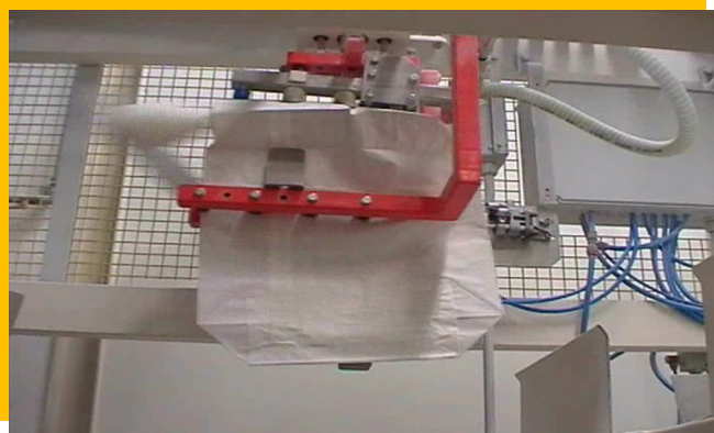
Dettaglio preparazione meccanica della valvola Bag in position to prepare the valve