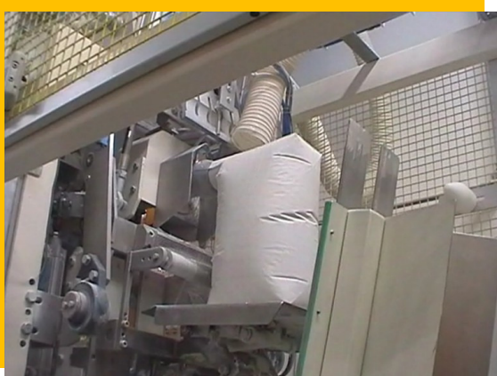
Dettaglio riempimento Bag during filling operation