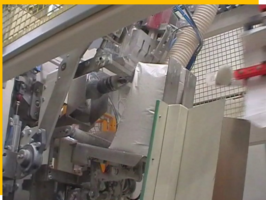
Dettaglio del sacco in posizione di riempimento prima della saldatura della valvola Bag in filling position before valve welding