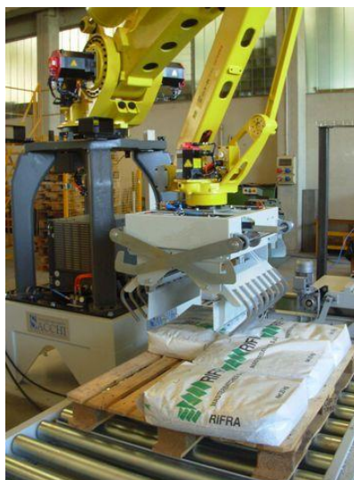
Foto disposizione sacco su paletta.

Quadro elettrico integrato all'interno del telaio portante.