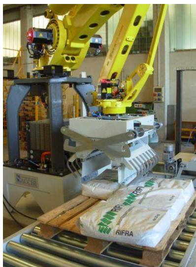
Foto disposizione sacco su paletta.

Quadro elettrico integrato all'interno del telaio portante.